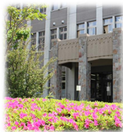
中学校・高等学校